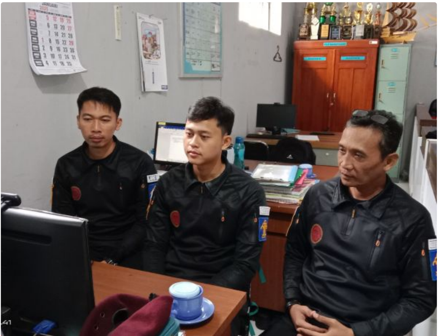
Bangun Harmoni dan Strategi, Lapas Besi Ikuti Webinar Refleksi Akhir Tahun 2024 & Resolusi 2025

CILACAP – Sebagai salah satu langkah dalam pengembangan kompetensi bagi