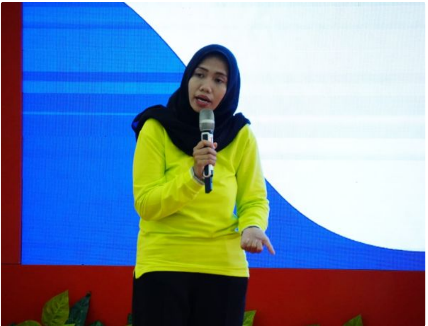
DWP Kemenkumham Jateng sampaikan Cegah Diabetes Melitus